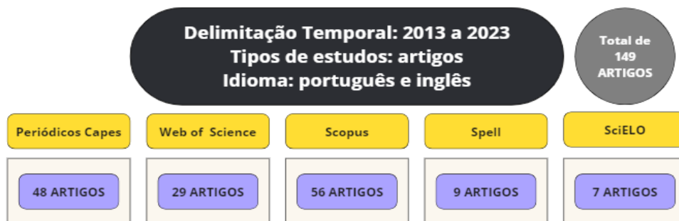
Figura 2. Critérios de busca bibliográfica

Em seguida, estabeleceram-se os critérios para a pesquisa bibliográfica. Realizou-se uma busca avançada por publicações cujos títulos incluíam os termos "assédio", "universidade" e "universitário". As bases de dados consultadas incluíram o Portal Spell , Scopus, Web of Science , Scielo e Periódicos Capes. O intervalo temporal considerado para a análise foi de dez anos, de janeiro de 2013 a dezembro de 2023, como demonstrado na Figura 2.